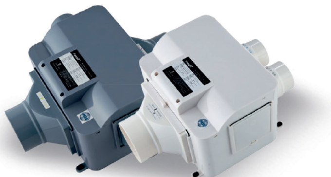
TFV-175P-3 (Модель Вытяжка)